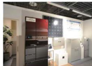
創エネリフォーム

外壁塗装や、屋根リフォーム、住宅設備の交換、ペット共生リフォームなど、さまざまなリフォームアイテムが一度にご覧いただけます！