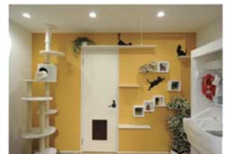
ペットリフォーム