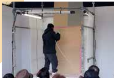
※上記写真はすべてイメージです。