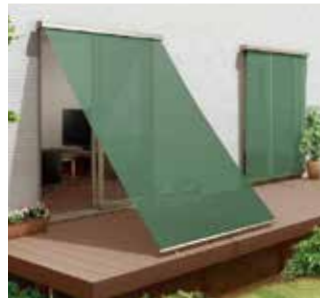
LIXIL/スタイルシェード(一例)